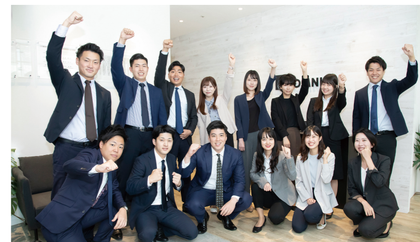
▲ 明るく若さあふれるスタッフが揃っているのでオフィスには常に活気が満ちている。