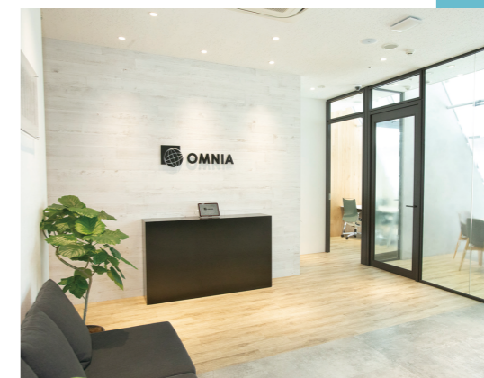
▲ 明るくおしゃれなオフィスでお客様にも好評。

度、人事評価制度、キャリア面談なども導入し、人材育成には力を入れています。従業員数は約25名で、平均年齢は29歳と非常に若い会社ですが、順調に業績拡大し、ビジョンに向けて若い力で邁進しています。私の座右の銘は「初志貫徹」です。自分で決めたことは、成し遂げるまで絶対に諦めません。お客様の願い、社員の願いも絶対に叶えるという思いで経営をしています。OMNIAという社名は、ラテン語で「全て、願い」という意味です。私たち自身、社員、家族、会社、関わってくれた全ての人の叶えるために、OMNIAはこれからも成長し続ける会社です。